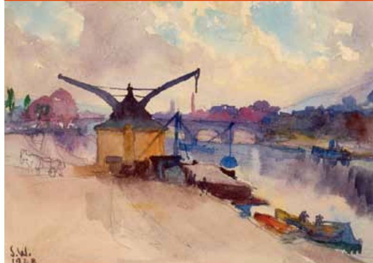
Tableau de Sosthème Weis: La Moselle près de Trèves.

Collection du Musée national d'histoire et d'art Luxembourg