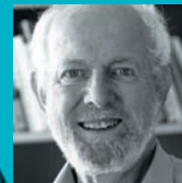
Prof. Dr. Ernst Ulrich von Weizsäcker