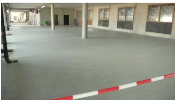
RETEVEMENT DE SOL: COLLE DIRECTEMENT SUR LES DALLES