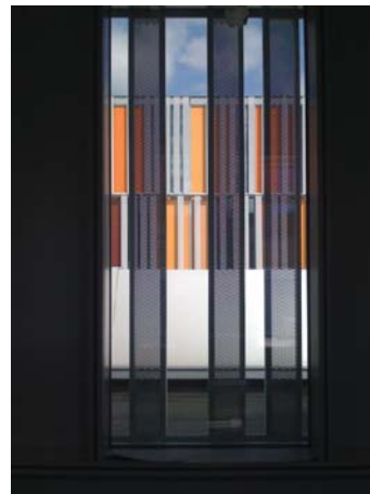
ELEMENT DE PROTECTION CONTRE LES INTEMPERIES