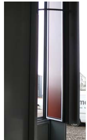
CLAPET DE VENTILATION MOTORISE ET ASSERVI A TRIPLE FRAPPE