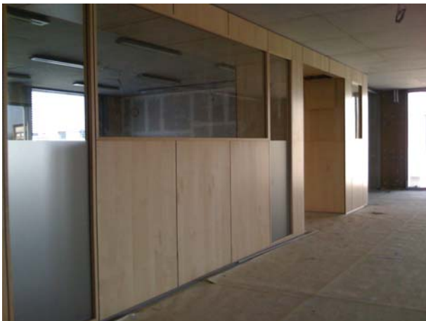
LUMIERE NATURELLE DANS LES COULOIRS PLAFONDS EN BETON BRUT - ACCUMULATEUR ET REGULATEUR THERMIQUE